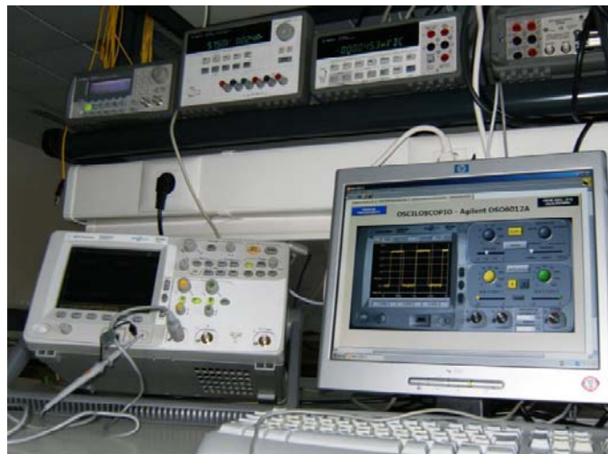
Figura 3. Puesto de instrumentación del laboratorio de Electrónica Avanzada.

Para la comunicación entre los distintos instrumentos del puesto de laboratorio, como ya se ha comentado, se utiliza el protocolo GPIB disponible en todos ellos.