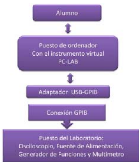
Figura 2. Estructura en el diseño del instrumento virtual.

Además, el presente trabajo ha logrado establecer una red GPIB, formada por los instrumentos del puesto del Laboratorio de Electrónica Avanzada: la fuente de alimentación, el multímetro digital, el generador de funciones y el osciloscopio. La red está conectada a un PC, mediante el adaptador GPIB-USB “82357B” de la marca Agilent®, siguiendo la estructura que refleja la figura (Fig. 2).