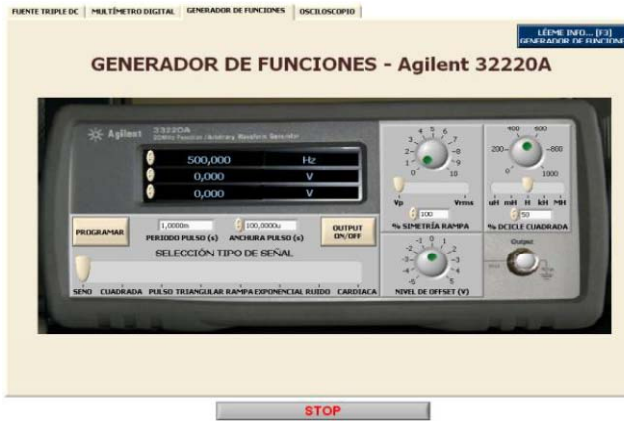
Figura 4. Estructura de la metodología empleada en la creación del instrumento virtual.